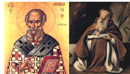
Martes, 13 de enero Sábado, 17 de enero Hilario de Poitiers Antonio Abad