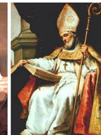
viernes, 26 de abril