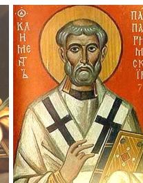
Martes, 23 de noviembre Clemente I