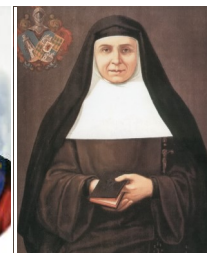
Viernes, 22 de mayo Joaquina de Vedruna