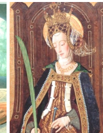
Jueves, 16 de abril Engracia