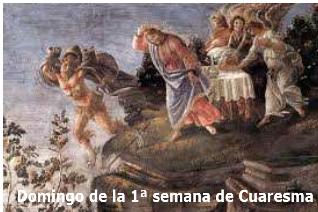
Domingo de la 1ª semana de Cuaresma