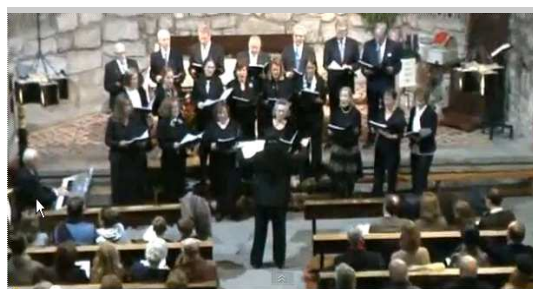
Concierto de Villancicos -Navidad 2011- en nuestra parroquia