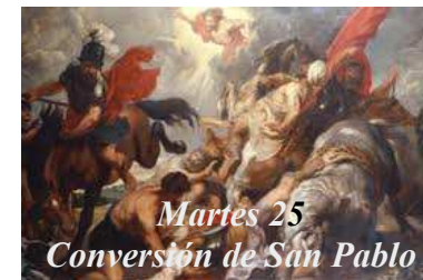
Martes 25 Conversión de San Pablo