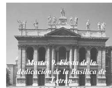
Martes 9. Fiesta de la dedicación de la Basilica de Letran