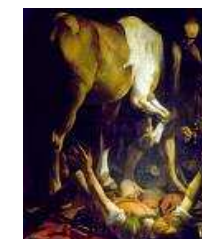
Lunes 25 Fiesta de la Conversión de San Pablo