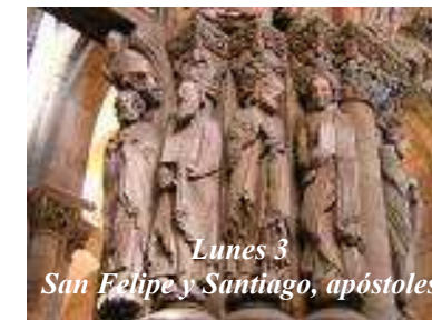
Lunes 3 San Felipe y Santiago, apóstoles