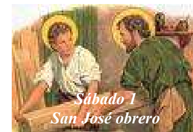
Sábado 1 San José obrero

PARROQUIA ASUNCIÓN DE NUESTRA SEÑORA. TORRELOZONES