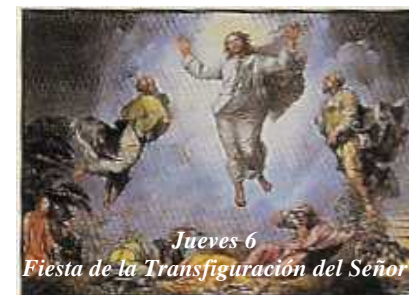
Jueves 6 Fiesta de la Transfiguración del Señor