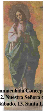
Lunes, 8. Inmaculada Concepción de María Viernes, 12. Nuestra Señora de Guadalupe Sábado, 13. Santa Lucía