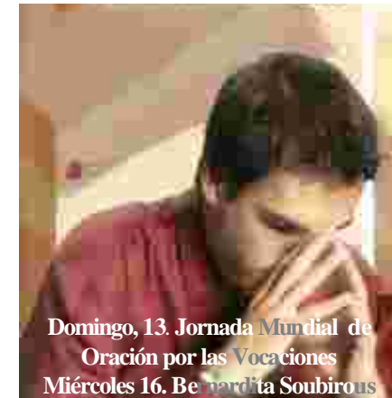
Domingo, 13. Jornada Mundial de Oración por las Vocaciones Miércoles 16. Beato Bernardita Soubirous