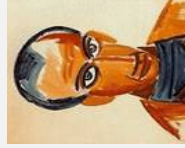
Max Jacob pintado por su amigo Pablo Picasso