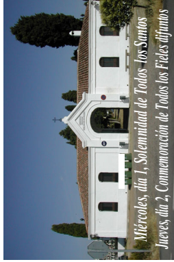
Miércoles, día 1, Solemnidad de Todos los Santos Jueves, día 2, Comemoración de Todos los Fieles difuntos