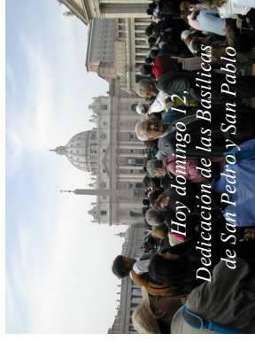
Hoy domingo 12. Dedicación de las Basílicas de San Pedro y San Pablo

Página Web: www.archimadrid.es/pasuntorre 28250 - TORRELODONES (Madrid)