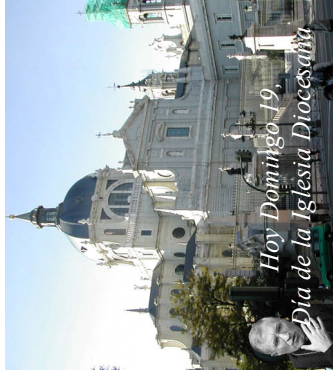
Hoy Domingo 19, Día de la Iglesia Diocesana