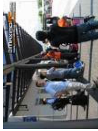
Hoy, día 24, Jornada mundial de la migraciones

Viernes, día 29, Santos Arcángelos, Miguel, Gabriel y Rafael