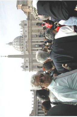
Martes, día 25, Santiago apóstol, patrón de España Miércoles, día 26, San Joaquín y Santa Ana (día de los abuelos)