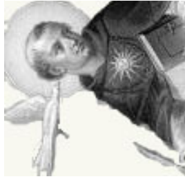
Miércoles, día 25, Conversión de San Pablo Sábado, día 28, Santo Tomás de Aquino

Después del primer pecado, el mundo ha sido inundado de pecados, pero Dios no ha abandonado al hombre al poder de la muerte, antes al contrario, le predijo de modo misterioso —en el «Protoevangelio»— que el mal sería vencido y el hombre levantado de la caída. Se trata del primer anuncio del Mesías Redentor. Por ello, la caída será incluso llamada feliz culpa, porque «ha merecido tal y tan grande Redentor» (Liturgia de la Vigilia pascual).