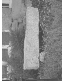
Mane nobiscum, Domine