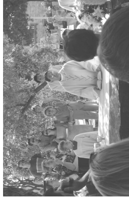
15 de agosto, domingo, Asunción de la Virgen María 16 de agosto, lunes, San Roque FIESTAS PATRONALES