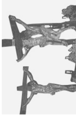
Jueves 25, San Dimas (Buen Ladrón)