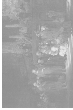
La mujer adúltera