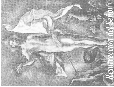
Resurrección del Señor