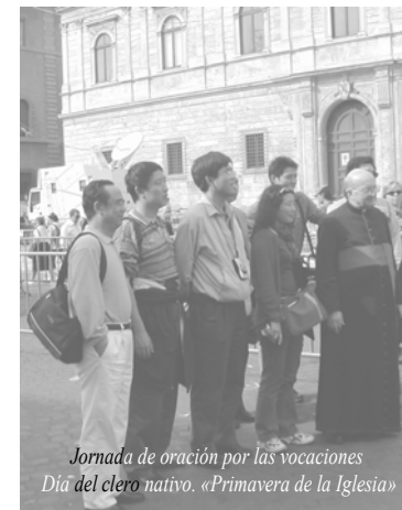
Jornada de oración por las vocaciones Día del clero nativo. «Primavera de la Iglesia»

PARROQUIA ASUNCIÓN DE NUESTRA SEÑORA. TORRELODONES