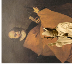
Sábado 22, la Catedral de San Pedro

En este 6º domingo tenemos la curación de un leproso. El mal, la enfermedad, se consideraba por los israelitas una consecuencia del pecado personal. No es consecuencia del pecado propio, pero sí del pecado original de nuestros primeros padres, que trastocó el entero orden de la creación. Desde entonces la cuestión de la existencia del mal está presente en la vida del hombre. No hay rasgo del mensaje cristiano que no sea, en parte, una respuesta a la misma: la bondad de la creación; el drama del pecado; el amor paciente de Dios que va al encuentro del hombre a través de sus 2 Alianzas, de la Encarnación redentora de su Hijo, del don del Espíritu Santo, de la Iglesia con los sacramentos y con la llamada a una vida santa que aceptamos o no libremente. En cualquier caso, lo que se pone en evidencia es la gran misericordia de Dios.