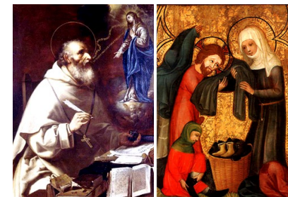
Jueves 15 de noviembre Alberto Magno Sábado 17 de noviembre Isabel de Hungría

PARROQUIA ASUNCIÓN DE NUESTRA SEÑORA. TORRELODONES