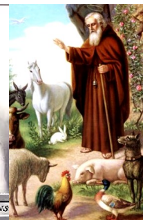
Miércoles 17 de enero Antonio Abad