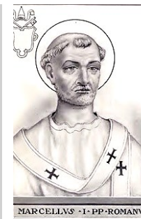
Martes 16 de enero Marcelo I, papa

PARROQUIA ASUNCIÓN DE NUESTRA SEÑORA. TORRELOONES