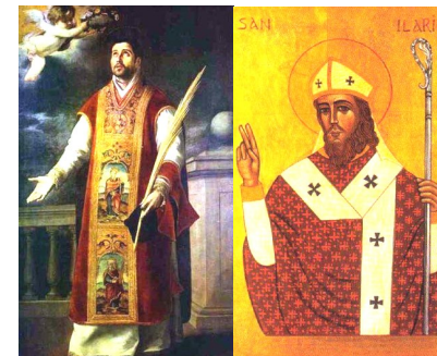
Martes 9 de enero Eulogio de Córdoba Sábado 13 de enero Hilario de Poitiers

PARROQUIA ASUNCIÓN DE NUESTRA SEÑORA. TORRELODONES