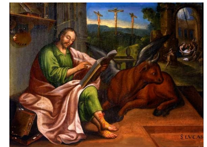
Miércoles 18 de octubre Lucas

PARROQUIA ASUNCIÓN DE NUESTRA SEÑORA. TORRELODONES