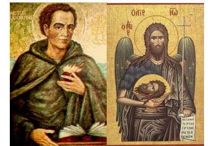
Lunes 28 de agosto Agustín Martes 29 de agosto Martirio del Bautista

PARROQUIA ASUNCIÓN DE NUESTRA SEÑORA. TORRELOONES