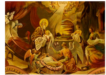
Viernes 8 de septiembre La Natividad de la Virgen María

PARROQUIA ASUNCIÓN DE NUESTRA SEÑORA. TORRELODONES