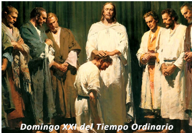
Domingo XXI del Tiempo Ordinario