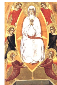
Martes 15 de agosto La Asunción Miércoles 16 de agosto Roque

PARROQUIA ASUNCIÓN DE NUESTRA SEÑORA. TORRELODONES