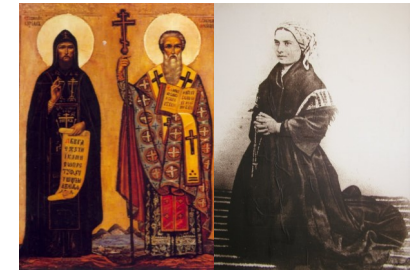
Martes 14 de febrero Sábado 18 de febrero Círculo y Metodio Bernardette Soubirous

PARROQUIA ASUNCIÓN DE NUESTRA SEÑORA. TORRELOZONES