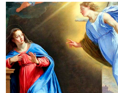
Sábado 25 de marzo La Anunciación del Señor

PARROQUIA ASUNCIÓN DE NUESTRA SEÑORA. TORRELODONES