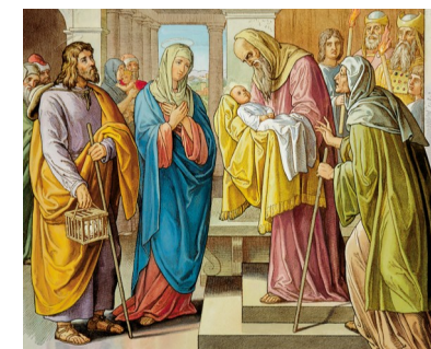
Jueves 2 de febrero La Presentación de Jesús y la Purificación de la Virgen