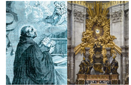
Martes 21 de febrero Pedro Damián Miércoles 22 de febrero La Cátedra de S. Pedro