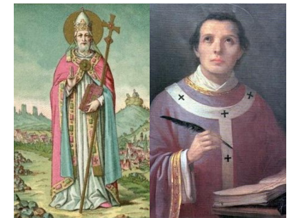
Miércoles 19 de abril León IX

PARROQUIA ASUNCIÓN DE NUESTRA SEÑORA. TORRELOZONES