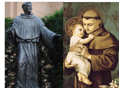
Lunes 12 de junio Martes 13 de junio Juan de Sahagún Antonio de Padua