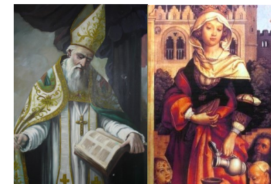
Martes 15 de noviembre Alberto Magno

PARROQUIA ASUNCIÓN DE NUESTRA SEÑORA. TORRELOONES