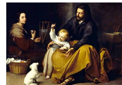
Viernes 26 de diciembre La Sagrada Familia