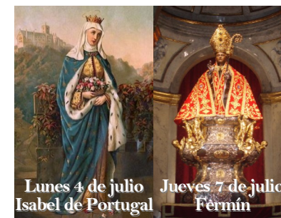
Lunes 4 de julio Isabel de Portugal