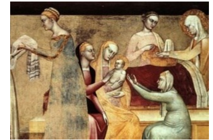
Jueves 8 de septiembre La Natividad de la Virgen María

PARROQUIA ASUNCIÓN DE NUESTRA SEÑORA. TORRELOONES