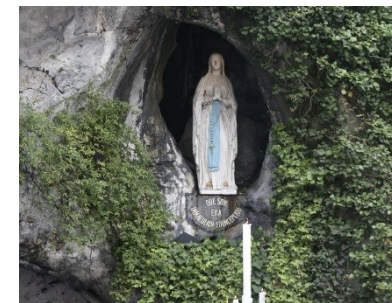
Jueves 11 de febrero Nuestra Señora de Lourdes

PARROQUIA ASUNCIÓN DE NUESTRA SEÑORA. TORRELOONES