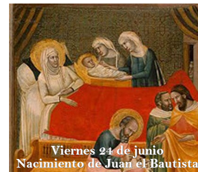
Viernes 24 de junio Nacimiento de Juan el Bautista

PARROQUIA ASUNCIÓN DE NUESTRA SEÑORA. TORRELOONES