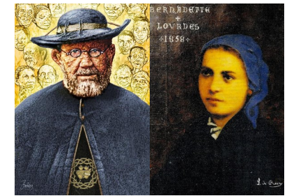
Viernes 15 de abril San Damián de Molokai

PARROQUIA ASUNCIÓN DE NUESTRA SEÑORA. TORRELOONES