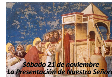
Sábado 21 de noviembre La Presentación de Nuestra Señora