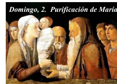
Domingo, 2. Purificación de María