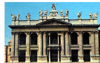
Sábado 9: Fiesta de la Dedicación de la Basilica de san Juan de Letrán

PARROQUIA ASUNCIÓN DE NUESTRA SEÑORA. TORRELODONES