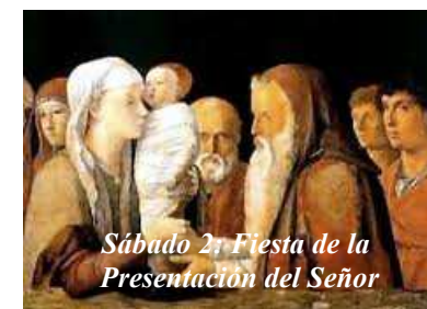
Sábado 21 Fiesta de la Presentación del Señor